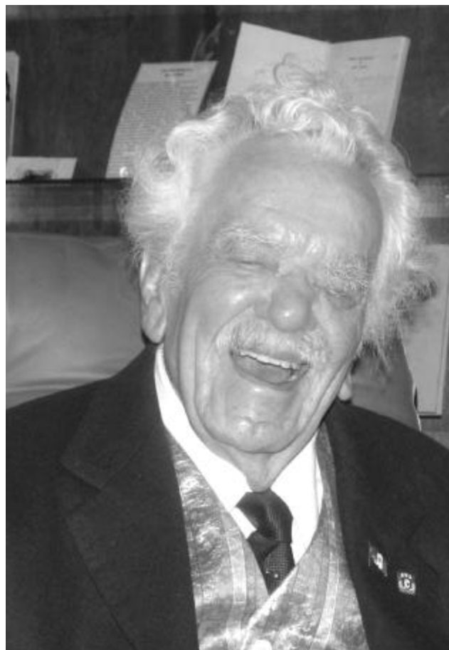
Rubén Bonifaz Nuño