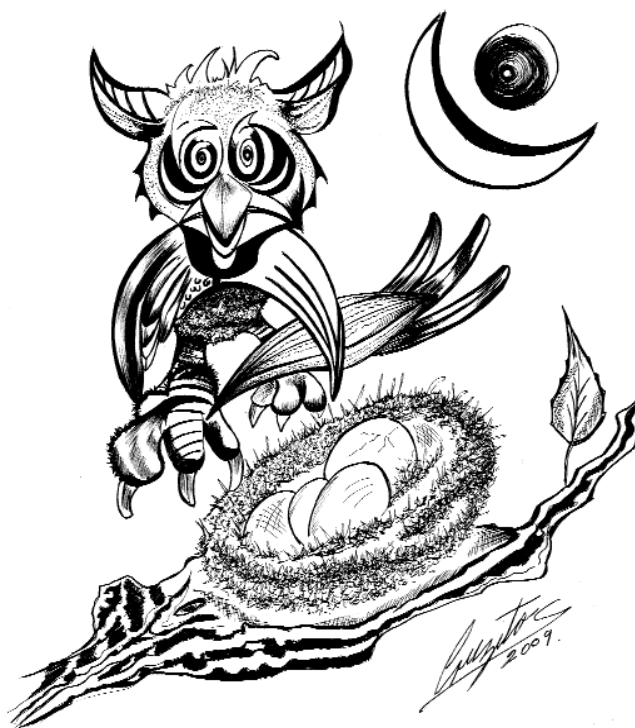
José Cruz Salinas

Se considera a Mariano Azuela el iniciador de este género novelístico. De sus actividades médicas al lado del famoso guerrillero Pancho Villa, obtuvo el material vivo que constituyen sus novelas, y la inspiración de una obra maestra de la literatura mexicana contemporánea: Los de abajo (1915). Con anterioridad, Azuela había escrito algunos