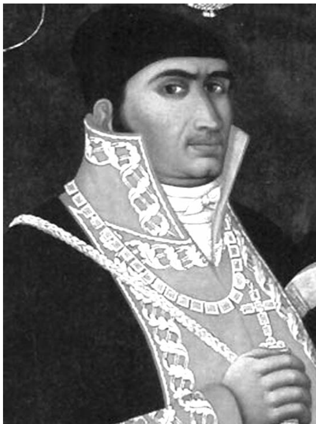
José María Morelos

Todo reo se pondrá en libertad con apercibimiento, y si incurriese en el mismo delito o en otro cualesquiera que desdiga a la honradez de un hombre, será castigado.