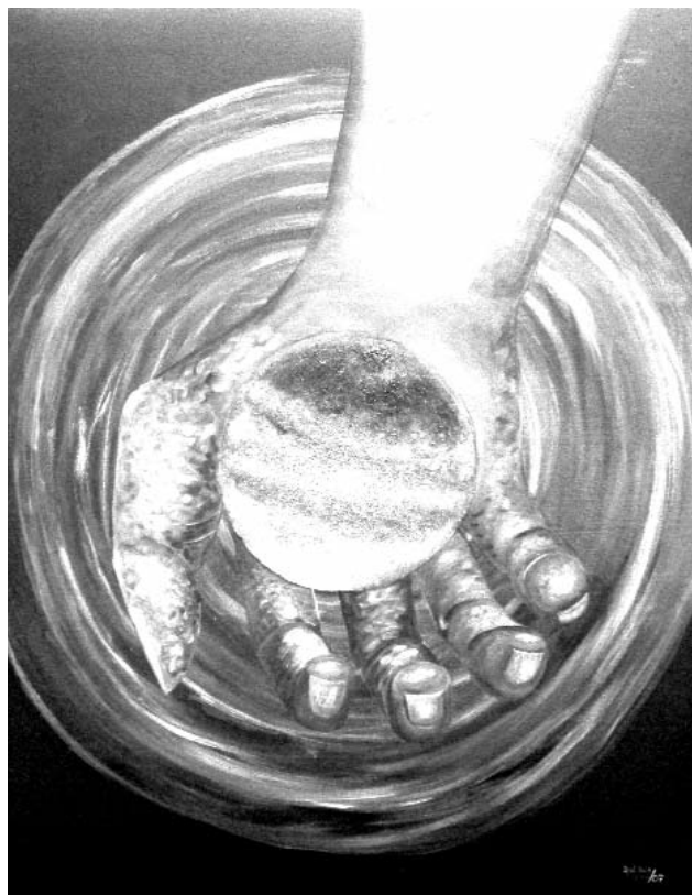
Marcela del Río