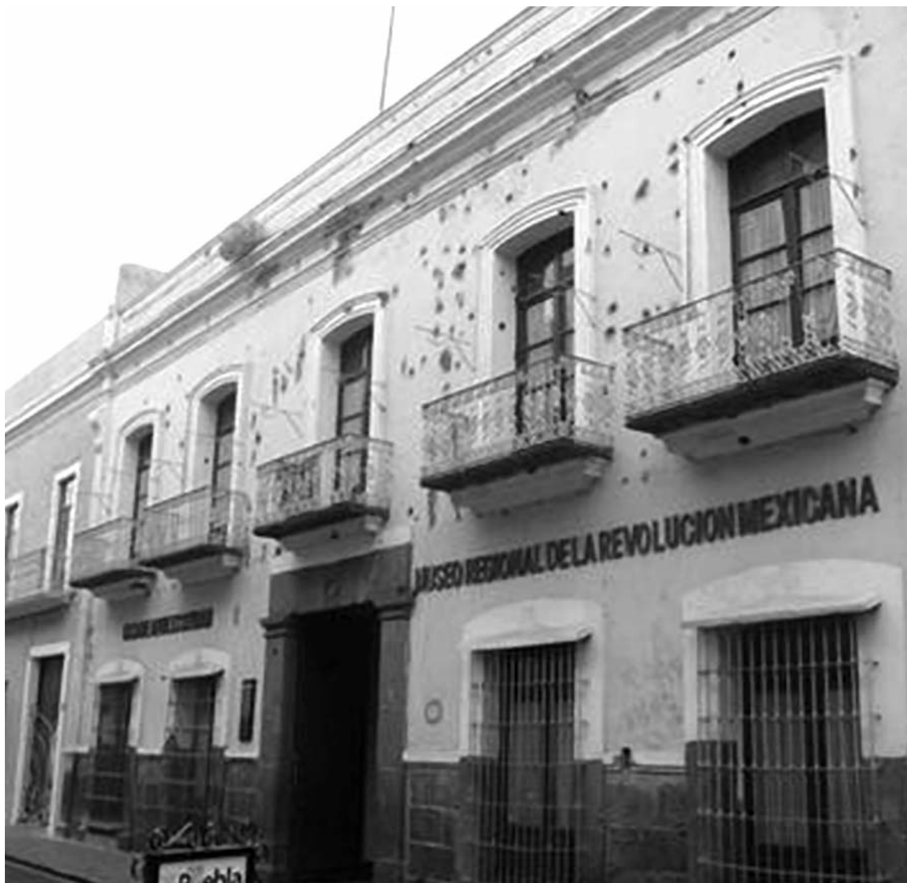
Casa de Aquilés Serdán