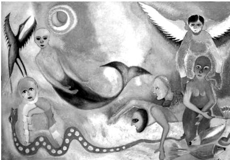
Miguel Ángel Toledo

¿No será conveniente averiguar si gastar tanto dinero, sin vender, forma parte de un plan para perder? 🐻