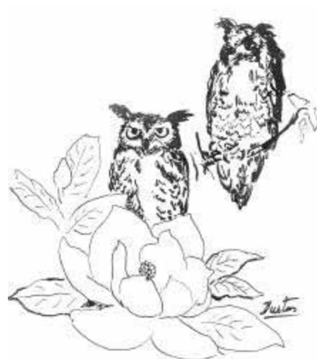
Arturo García Bustos