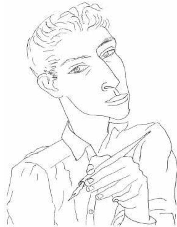
Autorretrato de Juan Soriano

Con el maestro Juan Soriano he sostenido varias conversaciones en su casa-estudio en la calle de Amsterdam, de la ciudad