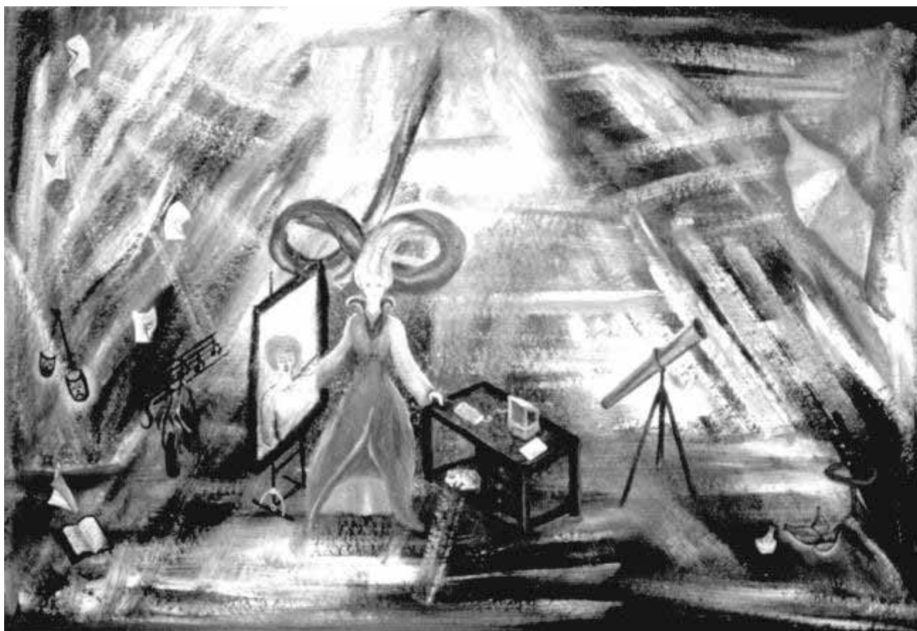
Marcela del Río