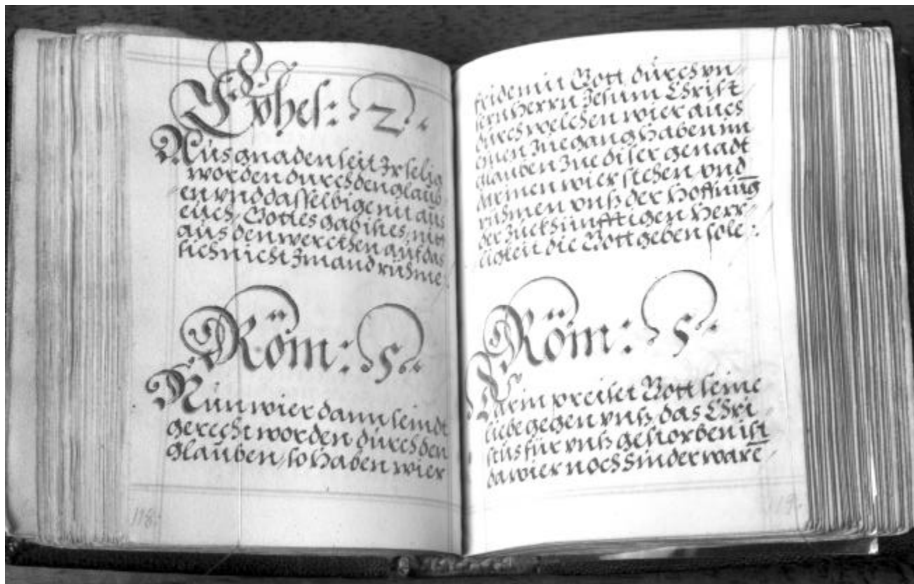
Imagen proveniente del libro Manual de oración